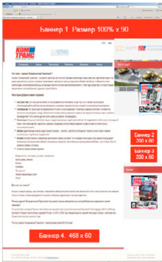
БАННЕР №1. Размер 100% x 90

журнал КОМТРАНС и Выставки COMTRANS / AUTOTRANS ГРУЗОВИКИ / АВТОБУСЫ / СПЕЦТЕХНИКА